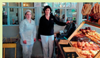
M me Tormens Responsable Lorpaul Thionville